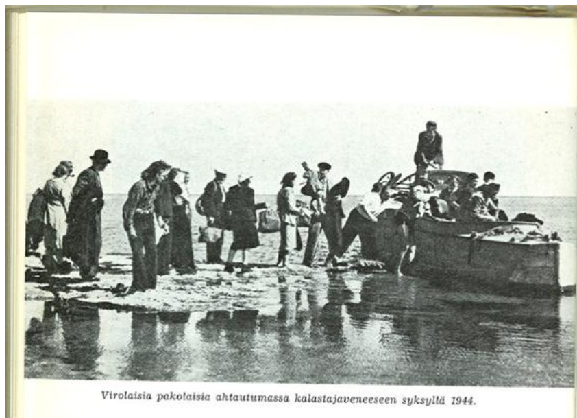
Virolaisia pakolaisia ahtautumassa kalastajaveneeseen syksyllä 1944.