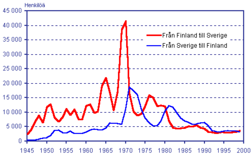
Migration mellan Finland och Sverige 1945–1999

Källa: Befolkningsförändringar (Statistikcentralen, H:fors); figur: Jouni Korkiasaari