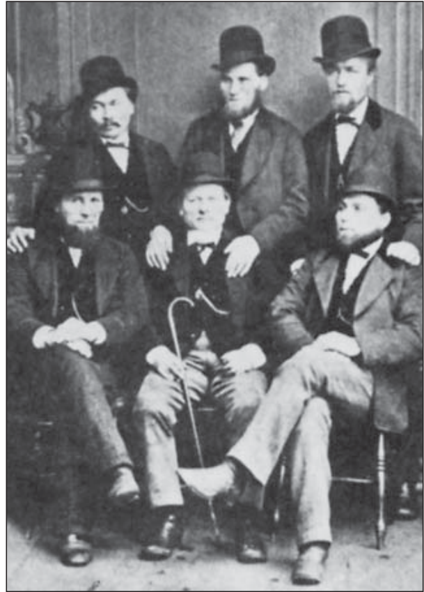
Merimiehet olivat Britannian suomalaisten suuri enemmistö pari sataa vuotta aina 1950-luvulle. He olivat usein kotoisin Ahvenanmaalta tai Suomen rannikkokaupungeista. Ahvenanmaalaiset merikapteenit kävivät Englannissa potretissa 1870-luvulla.

Merimiesten määrä, joka v. 1853 ylitti 6 200, kasvoi jopa noin 15 000 mieheen ennen ensimmäistä maailmansotaa. 31 Heistä arviolta puolet purjehti ulkomaalaisilla laivoilla, joissa palkat olivat huomattavasti korkeampia kuin suomalaisilla aluksilla. 32