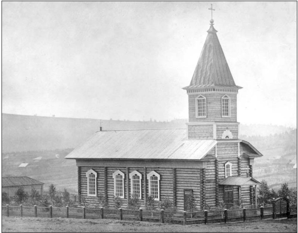
Verhne Suetukin kirkko Minusinskin piirikunnassa.